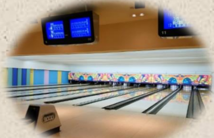
ボウリングで楽しく交流！