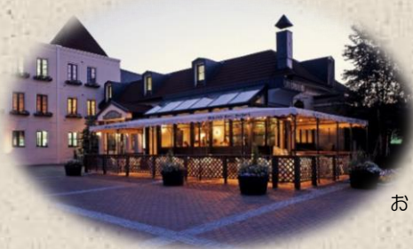
おしゃれなレストランで懇親会！