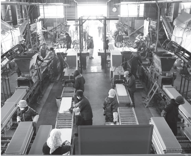
2つの製造ラインが稼動していました

操業は17日まで行われ、ペーパーポット34,200冊の製造(面積570ha分)と、組合員ハウスへの配送作業を行い、全工程が無事に終了しました。