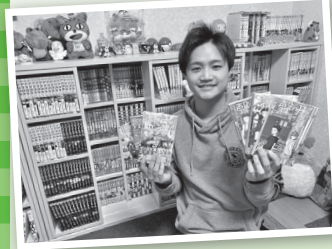
オススメの本を手にする大川職員

...まだまだ紹介したい作品はありますが、この場ではここまでとさせていただきます!他にもおすすめが知りたい!という方がいれば、気軽に声をかけてください! また、皆さんのおすすめの漫画、アニメをぜひ教えてください!お待ちしております!