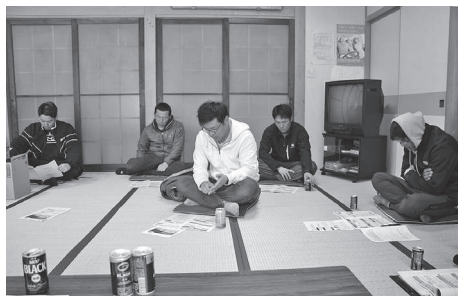
豊川地区の皆さん