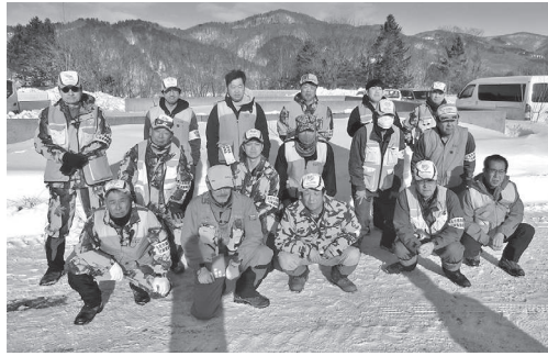
一斉捕獲に参加した猟友会の皆さん

されました。 猟友会常呂分会は、今回の一斉捕獲のみならず、4月から11月の有害駆除や冬期間のワッカ地域の駆除、ヒグマによる人身事故防止に向けた見回りの巡回など有害鳥獣被害防止にご協力をいただいております。 また有害鳥獣対策を効果的に行うために地域の被害状況を関係機関に伝える必要がありますので、被害調査報告にご協力をお願いいたします。