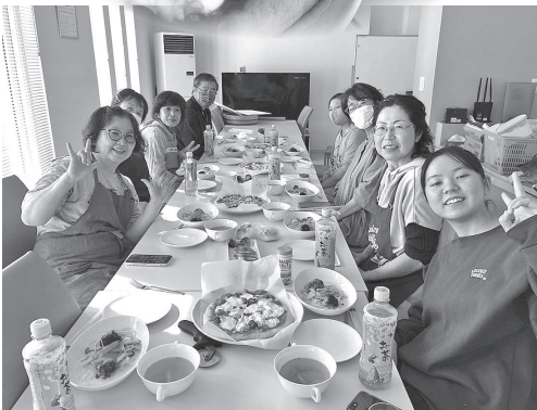
(上) 完成したチーズを使用した料理 (下) 参加した皆さんでいただきます!