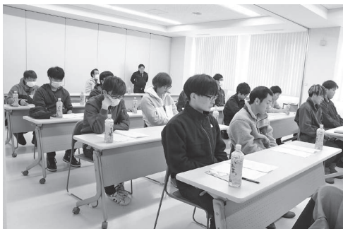
総会に出席したクラブ員の皆さん

議案第1号の事業報告並びに収支決算についてから第7号のその他までのすべての議案が慎重審議の結果可決されました。 また本総会では役員改選が行われ、次の通り選任されました。（敬称略）