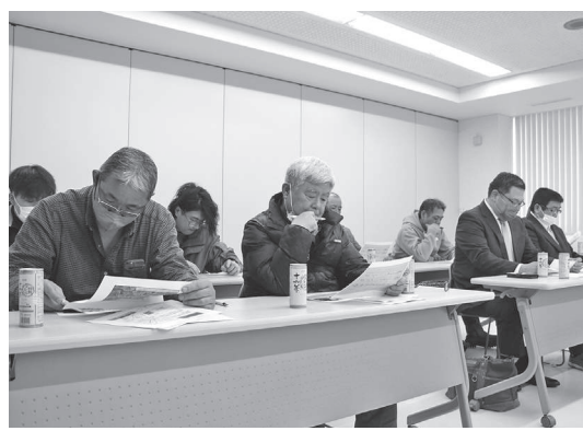
総会に出席した組合員の皆さん

議案第1号の令和5年度事業報告並びに収支決算の承認についてから議案第5号のその他のまでのすべての議案が慎重審議の結果可決されました。