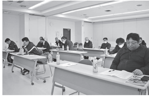
東浜・土佐地区の皆さん

本目標として設定している、第9次常呂町農業振興計画と合わせて、組合員の皆さまと対話を昨年引き続き実践することとしております。