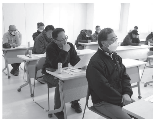
総会に出席した組合員の皆さん

令和6年度も組合員一丸となり安定生産、面積拡大に向けて努めることを確認し、閉会しました。