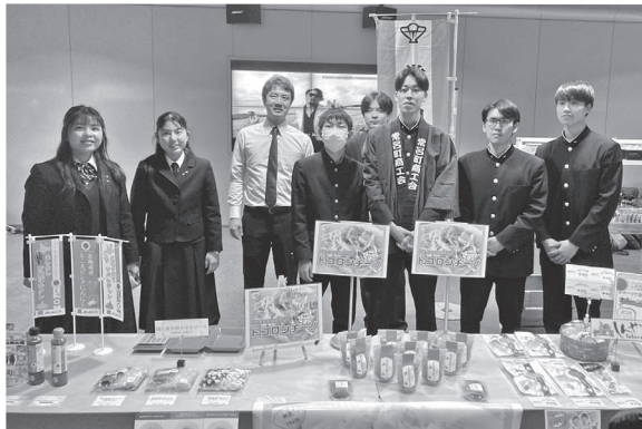
チ・カ・ホで販売実習を行った高校生の皆さん

されました。 猟友会常呂分会は、今回の一斉捕獲のみならず、4月から11月の有害駆除や冬期間のワッカ地域の駆除、ヒグマによる人身事故防止に向けた見回りの巡回など有害鳥獣被害防止にご協力をいただいております。 また有害鳥獣対策を効果的に行うために地域の被害状況を関係機関に伝える必要がありますので、被害調査報告にご協力をお願いいたします。