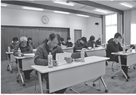
福山・日吉地区の皆さん

令和6年度の基本方針では「北海道550万人と共に創る『力強い農業』と『豊かな魅力ある地域社会』の実現」という将来ビジョンのもと、当JAの令和6年度事業の基