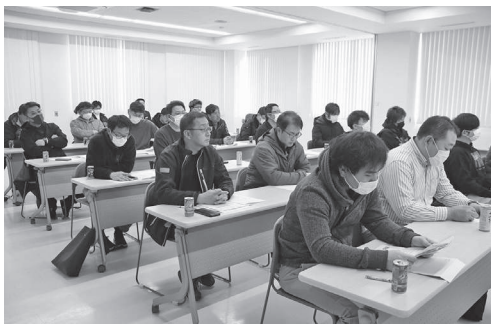
総会に出席した組合員の皆さん

今年度の「組合インセンティブ表彰」では地区別上位3地区（1位／共立、2位／福山地区、3位／土佐第1）を表彰し、引き続き個人別上位3人を表彰しま