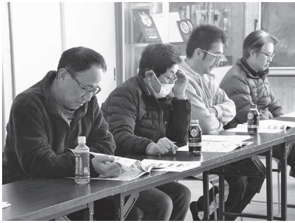
岐阜地区の皆さん

はじめに網走農業改良普及センターの職員から各農作物の育苗管理や施肥、播種を中心に説明しました。その後、組合員から秋小麦の追肥の考え方や縮萎縮抵抗性の新品種について、馬鈴薯では澱粉原料用馬鈴薯の疎植栽培による多収技術や前作甜菜茎葉すき込みによる減肥の目安、甜菜では直播栽培における風害対策や雑草対策、玉葱では育苗