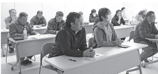
講習会に参加した組合員の皆さん

「てんさい直播栽培技術の現状と基本技術」について講習会を行いました。直播栽培比率も近年高まり、移植との比較、リスク確認、栽培ポイントについて確認致しました。終了後、令和7年度試験成績報告を網走農業改良普及センター、営農推進室より報告を行いました。