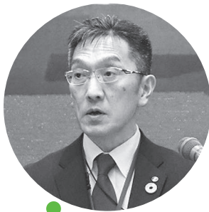
祝辞を述べる 宮前支所長

おけるゲタ単価の見直しの是非について検討し、結論が示される予定です。引き続き役員一丸となつて要請活動に取り組みまいります。」 さらに、「本年は第10次農業振興計画の実践1年目であり、メインスローガン『農力で未来につなごう常呂農業』のもと、『ものづくり・組織