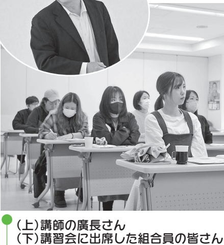
(上) 講師の廣長さん (下) 講習会に出席した組合員の皆さん