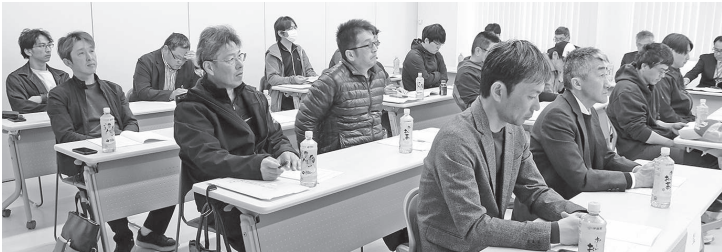
● 総会に出席した盟友の皆さん