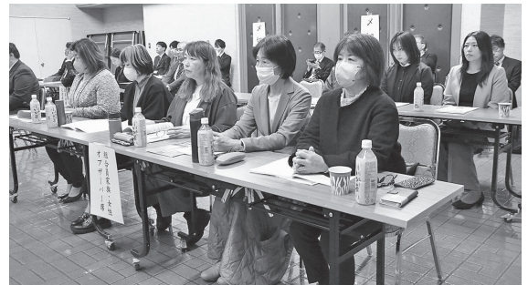
● 総会に出席した女性部役員の皆さん

道農業の確立に向け、JAグループが一丸となって力強い政策支援を求めていくことが重要です。 経営所得安定対策においては、令和7年産の数値を推計して算定に用いるなど、直近の生産費高騰を反映した見直しが図られました。てん菜及びでん原馬鈴薯については基準精度や基準でん粉含有率の見直しにより実質的な単価の上乗せとなった一方、小麦については交付金単価が引き下げられる結果となりました。今後は現行の3年に一度の改定にとらわれず、令和9年に