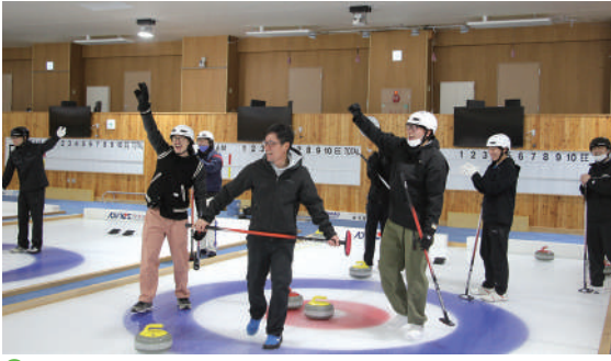
カーリングを楽しむ参加者

同交流会は毎年各単組で担当を持ち回りのしており、今年度は当JA青年部が担当に割り振られていました。役員らで話し合いをした結果「カーリング体験」を行いました。