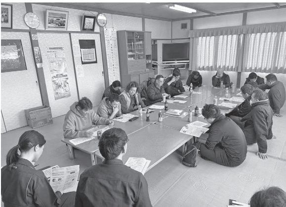
移動農事相談に出席した皆さん

はじめに網走農業改良普及センターの職員から各農作物の管理や播種のポイントなどについて説明しました。また、今回は農業試験場から発表された「養分