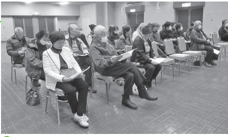
● 総会に出席した会員の皆さん