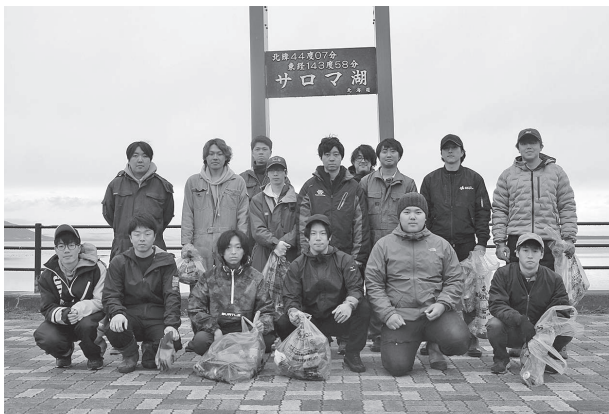
ゴミ拾い後に集合写真を撮りました

人が出席し、祝辞を述べました。その後、クラブ員全員から新規就農者に向けて自己紹介が行われました。激励会終了後に