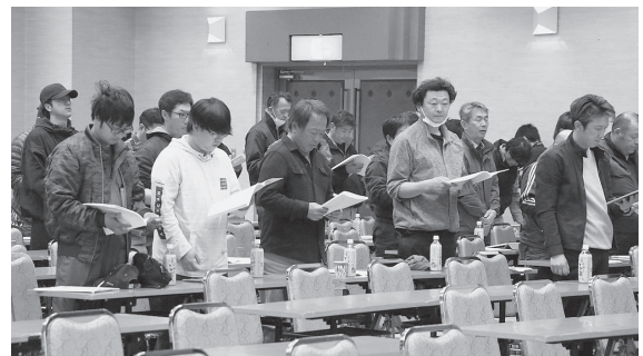
● 綱領を朗読する組合員の皆さん

を増し、農業経営に大きな影響を及ぼす1年となりました。こうした中、世界的な食料情勢の変化に伴う食料安全保障上のリスクの高止まりや、地球温暖化への対応と持続可能性の確保、国内生産基盤の弱体化など、我が国の農業を取り巻く情勢は大きく変化しています。 また、四半世紀ぶりに改正された新たな食料・農業・農村基本計画が本格的に施行される年となり、国民一人一人の食料の安全保障の確保や、環境と調和のとれた食料システムの実現、持続可能な北海