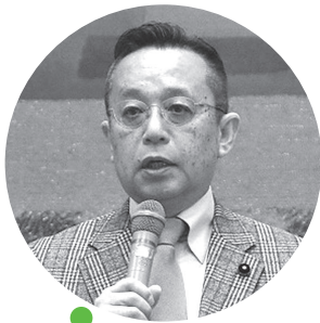
祝辞を述べる 船橋道議