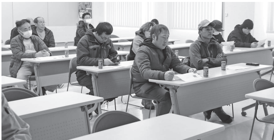
講習会に参加した会員の皆さん