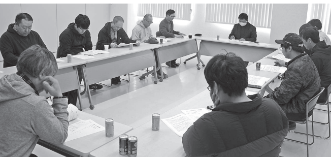
● 総会に出席した会員の皆さん