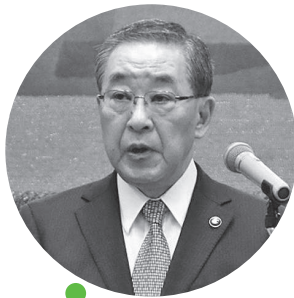
祝辞を述べる 辻市長