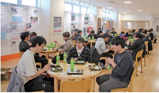
昼食を取りながら交流を深めました

交流会に参加した盟友は、初めてのカーリング体験に終始盛り上がり、盛会のうちに競技が終了しました。競技終了後はカーリングホールの2階で昼食会を開き、お互いの近況や競技の感想を話すなど、楽しく交流を行いました。