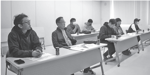
講習会に出席した部会員の皆さん